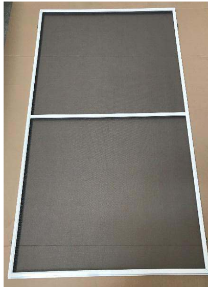
Spannrahmen mit Zwischenleiste

Team Horrentotaal.nl möchte Ihnen danken für Ihren Ankauf und wünscht Ihnen viel Spaß mit Ihrem Spannrahmen!