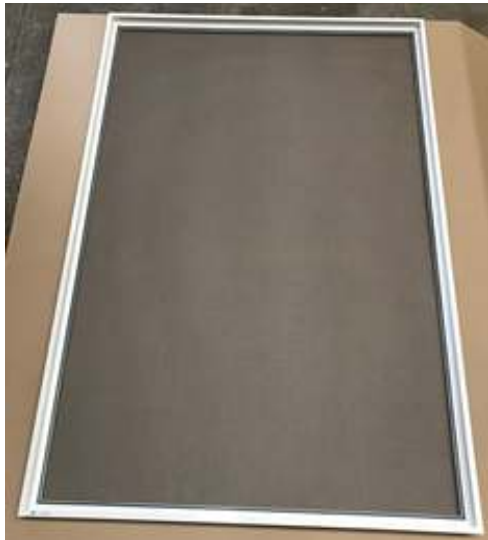
Spannrahmen ohne Zwischenleiste